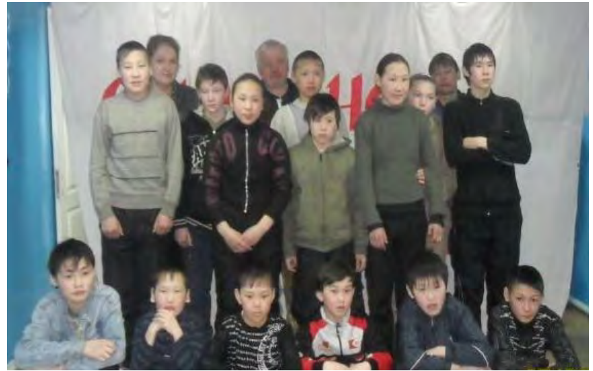
Юные промысловики поселка