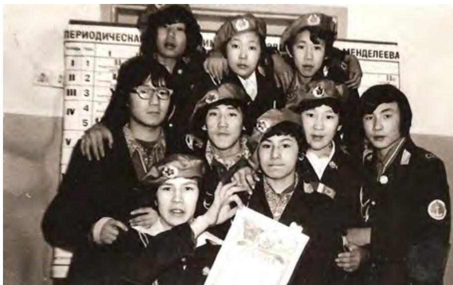
Ученики Волочанской школы конца 70-х г.