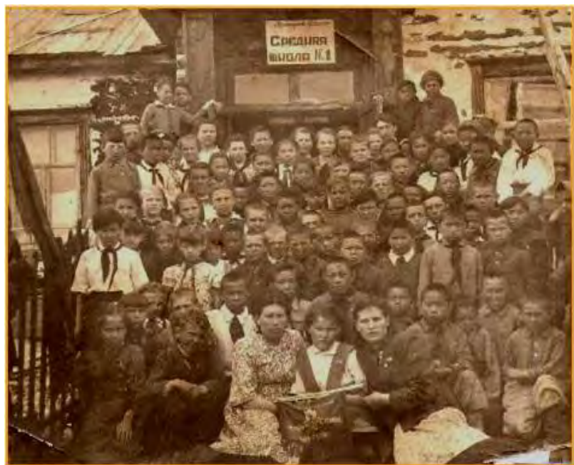
Учащиеся школы. 1949 год