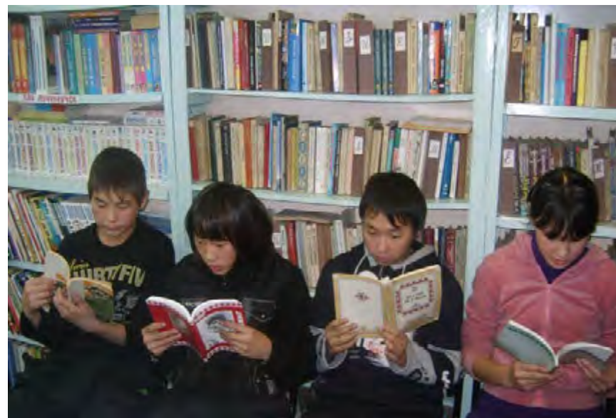
Юные читатели библиотеки