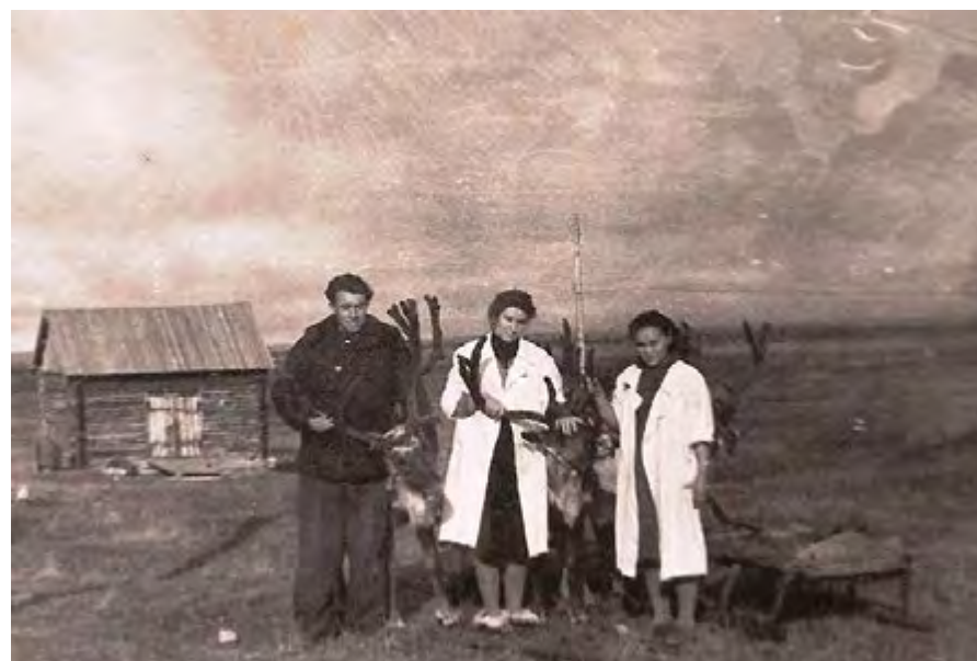
Ветеринары в тундре