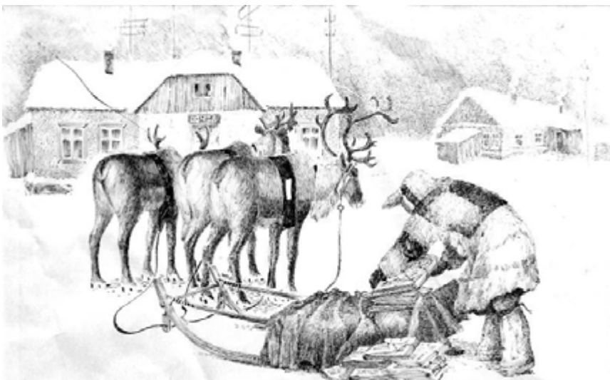
Почтарь села Волочанка. Художник М. Турдагин