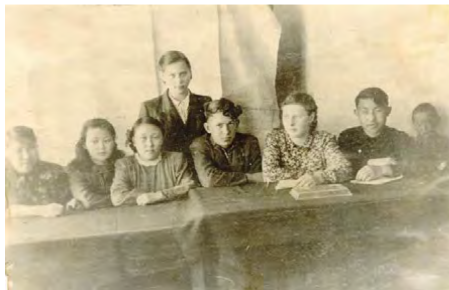
Ученический комитет Волочанской средней школы. 1954 год