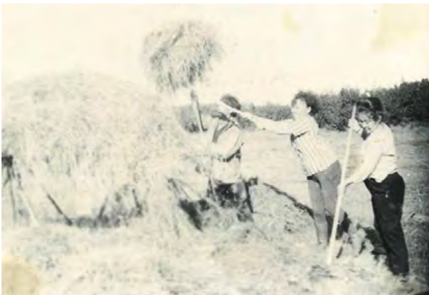
Сенокосная пора. 1966 год