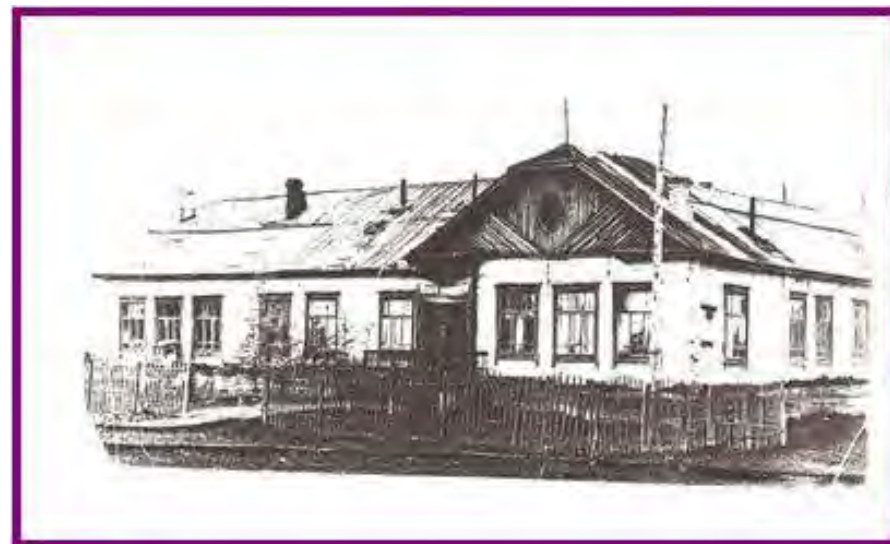
Школа 50-60 гг.