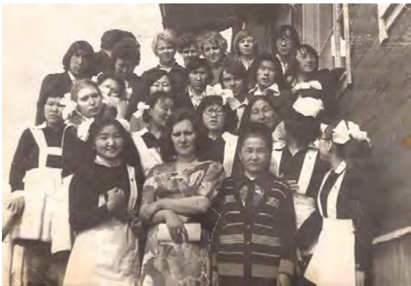
Выпускники школы. 1979 год