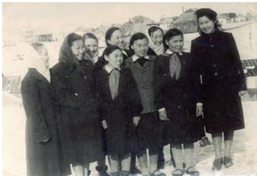
Школьницы 50-е годы