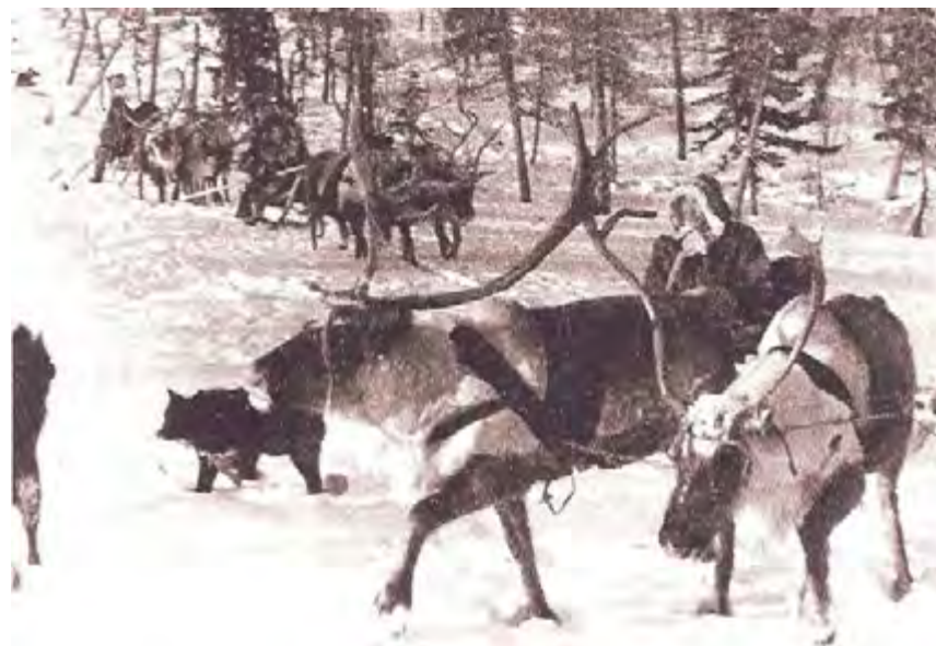
Выезд в тундру