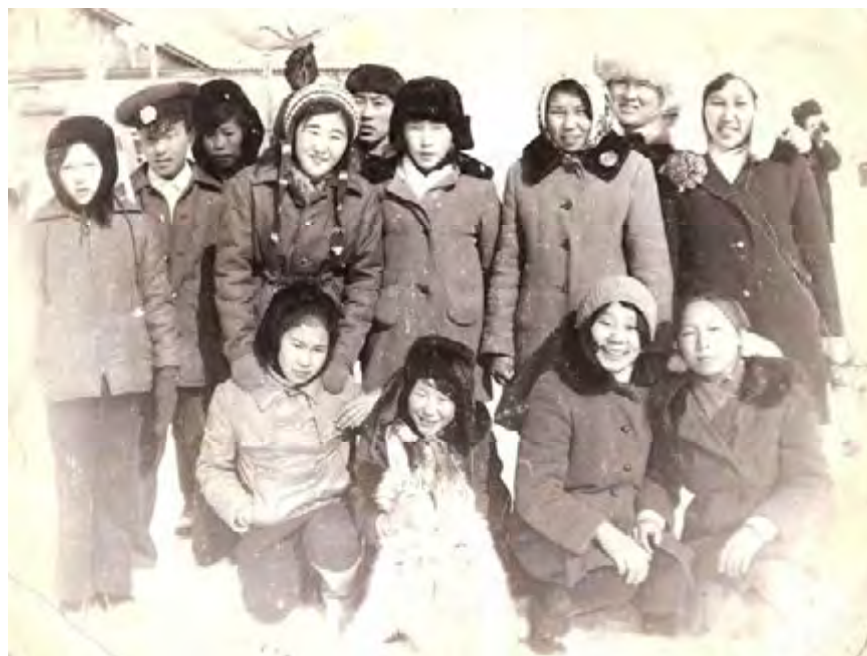
Учащиеся школы середина 70-х г.