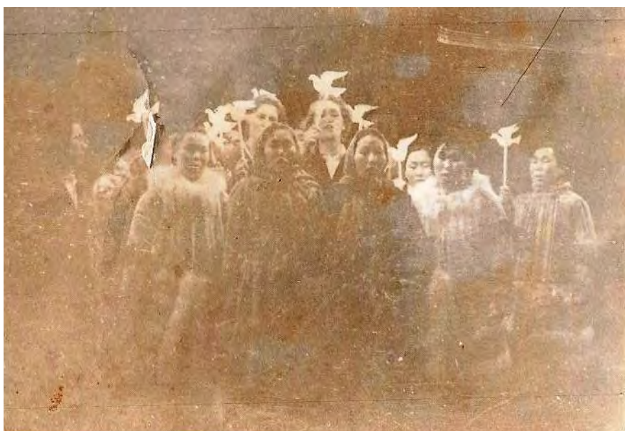
Первомай на фактории Усть-Боганида