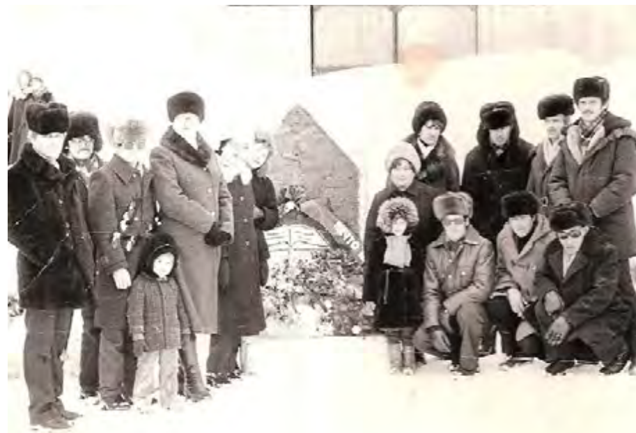
У первого памятника. 1984 год