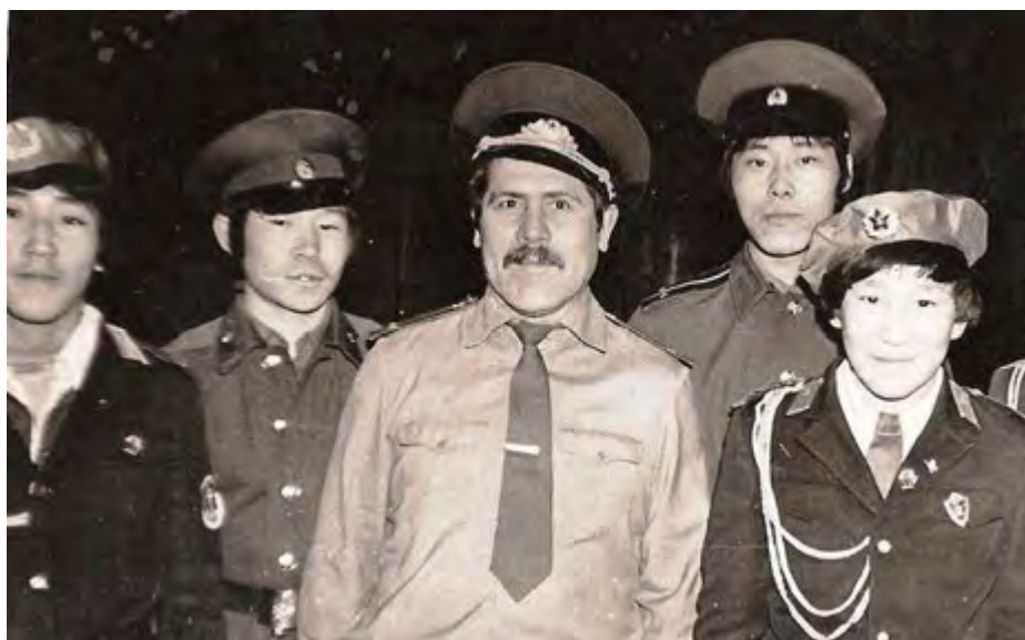
Смотр военной песни и строя