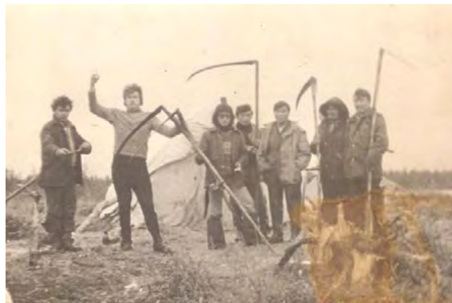
Сенокосчики совхоза Волочанский