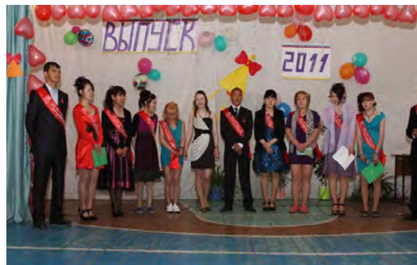
Выпускники. 2011 год