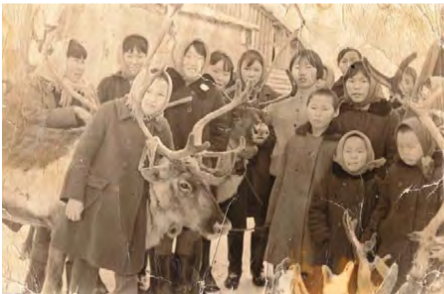
Воспитанники интерната. 1966 год