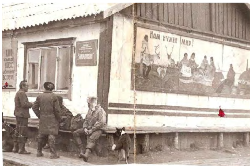
Здание совхоза Волочанский