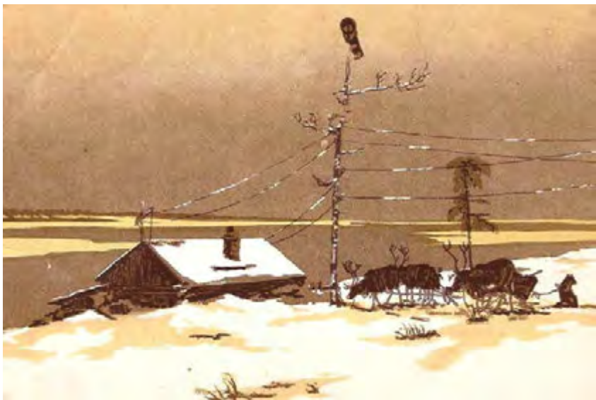
Далекий аэропорт. Художник В. Мешков (первый аэропорт посёлка)