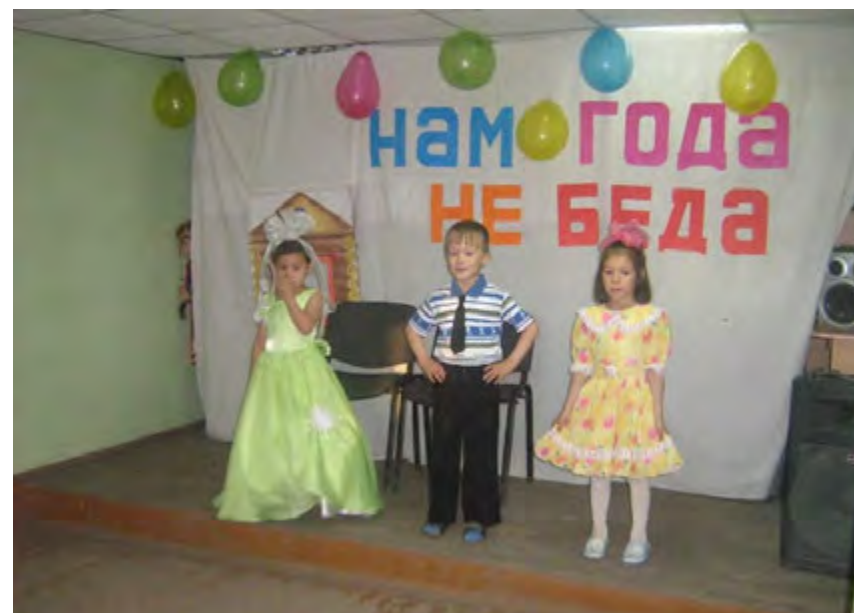
Праздники в детском саду