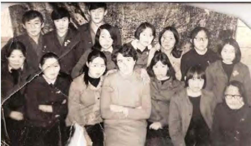
Старшеклассники конца 70-х г.