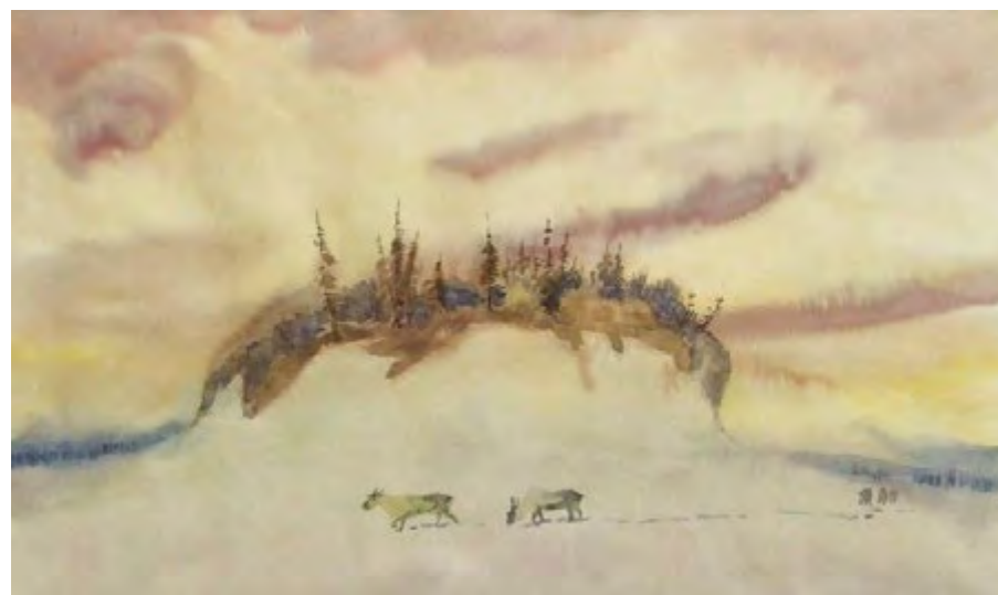
Окрестности поселка Волочанка. Художник М. Турдагин