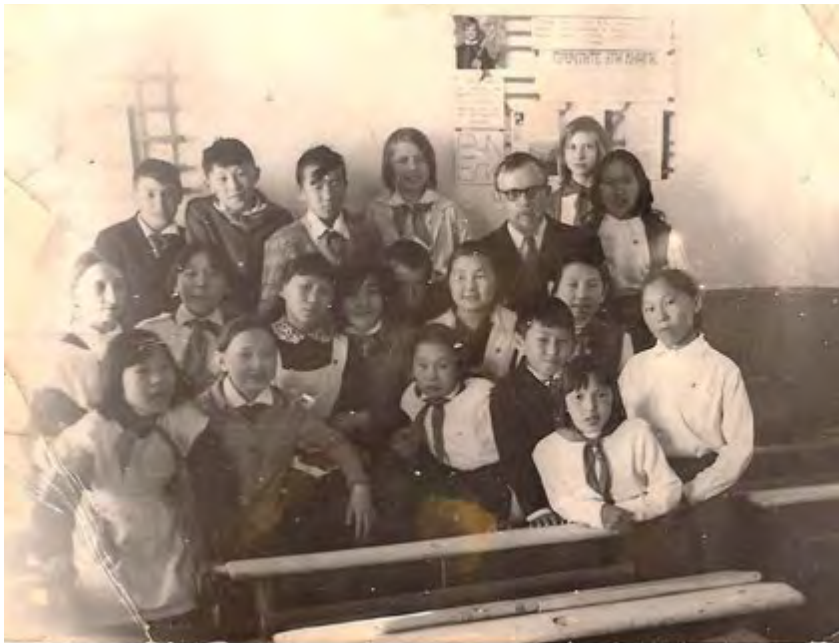
Ученики школы середины 70-х г.