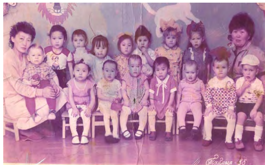
Ясли детсада. 1988 год