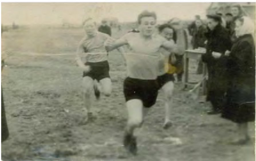
Спортивные соревнования, сентябрь. 1956 год