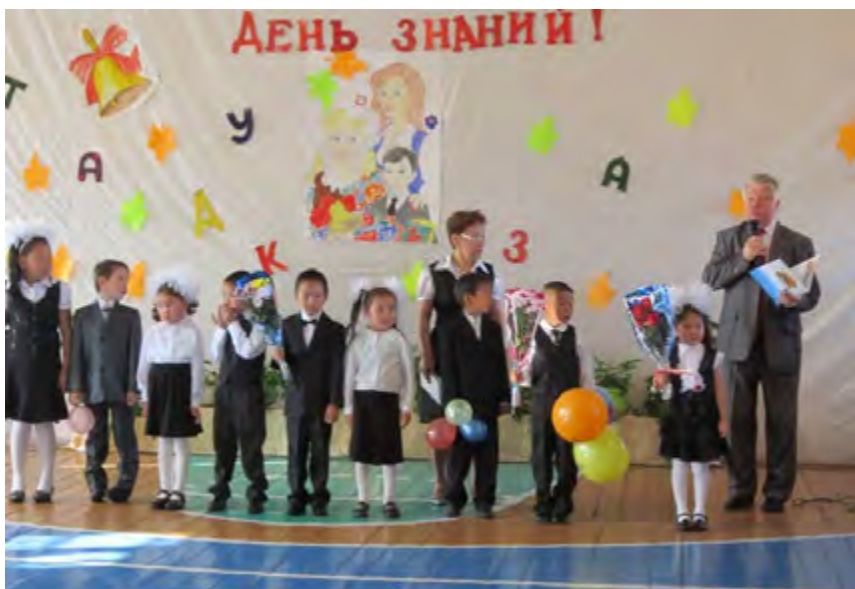
Приветствие первоклассников. 1 сентября 2011 год