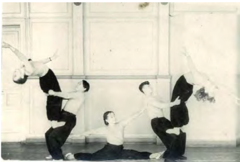
Спортивные номера, школьники. 1953 год