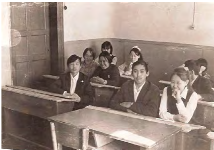
Ученики Волочанской школы начала 70-х г.