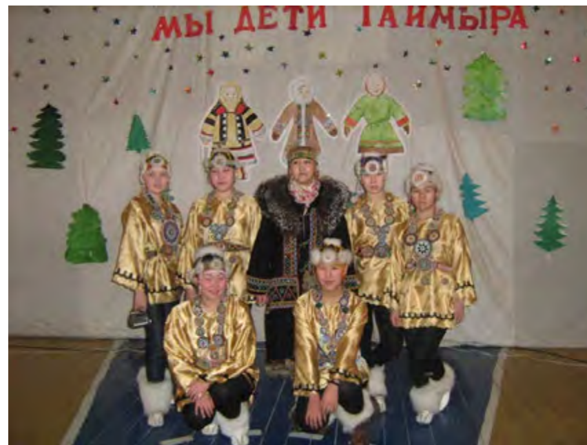
Юные таланты поселка