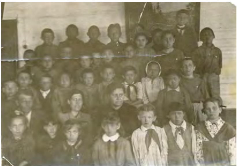
Учащиеся школы 40-е годы