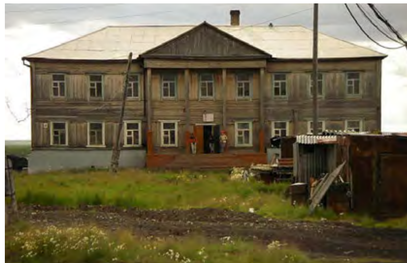
Волочанская средняя общеобразовательная школа № 15 имени Огдо Аксеновой