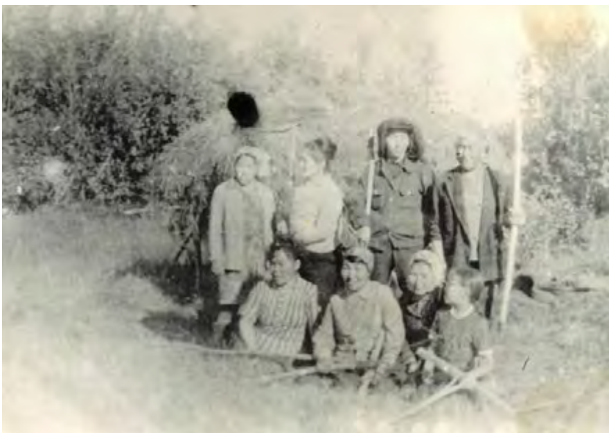
Сенокос. 1966 год