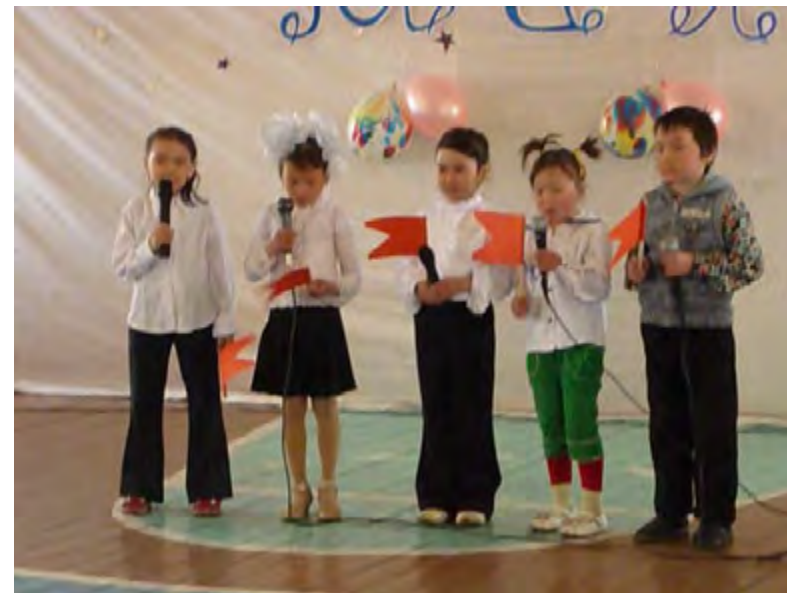
Мероприятие, посвященное Дню Победы