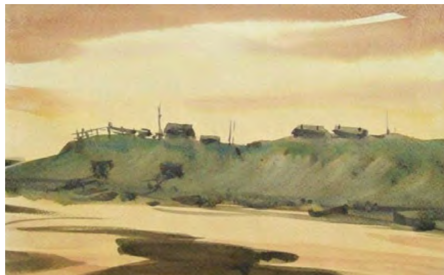
Звероферма Волочанки. Художник М. Турдагин