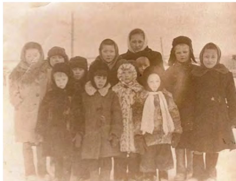
Учащиеся Волочанской школы. 1954 год