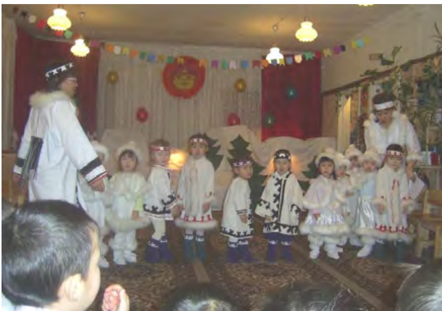
Праздники в детском саду