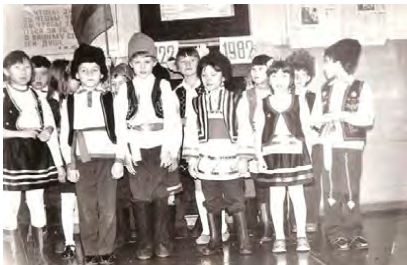
Смотр художественной самодеятельности к 60-летию СССР