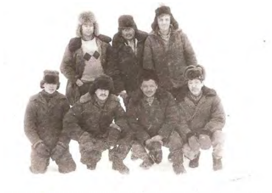
Работники МПП ЖКХ