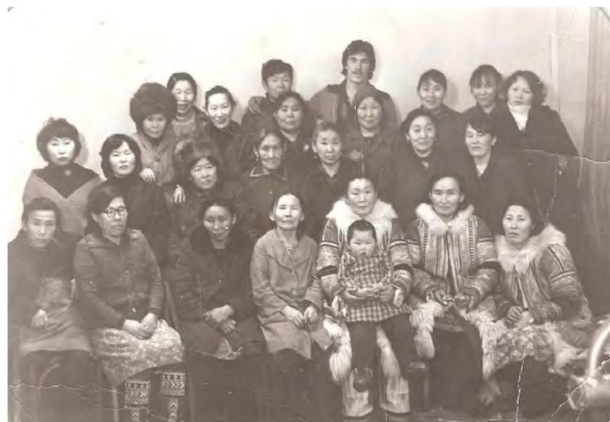
Мастерицы пошивцеха совхоза