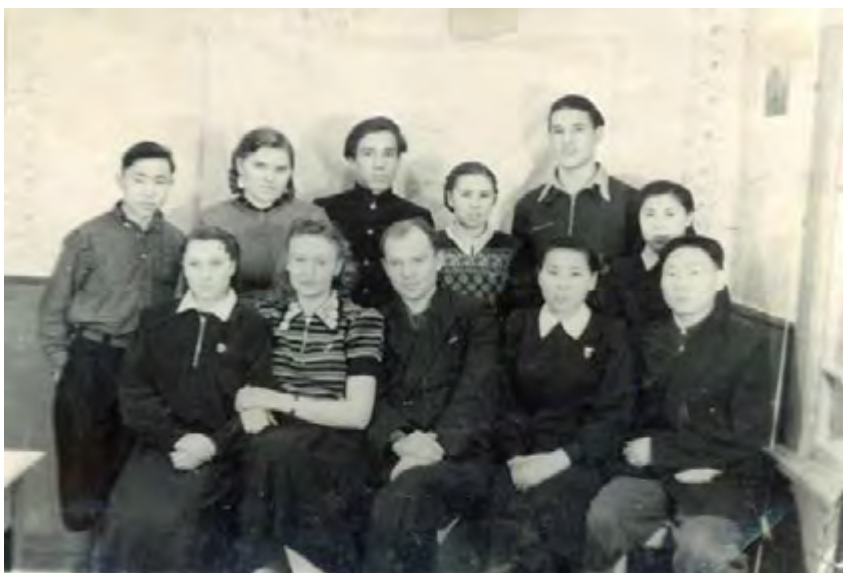
Комсомольская ячейка пос. Волочанка