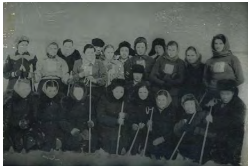
Лыжные соревнования 50-е годы