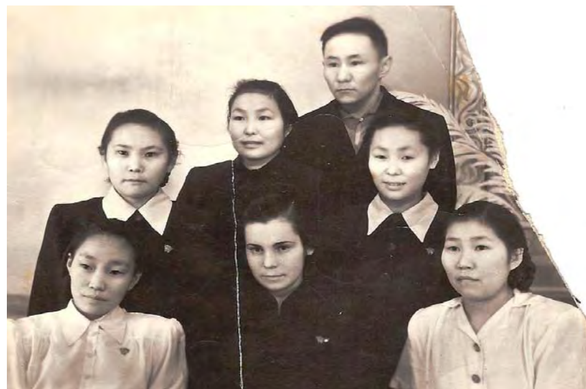
Будущие учителя. 1953 год