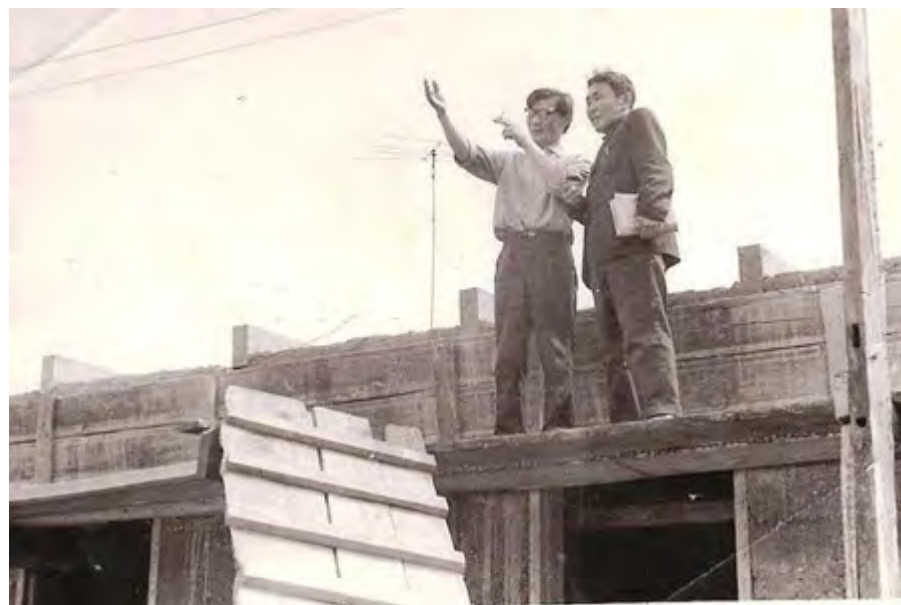
На строительстве домов посёлка