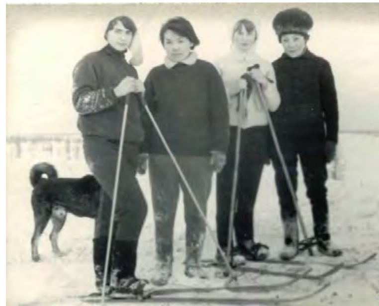
Выходной день. 1966 год