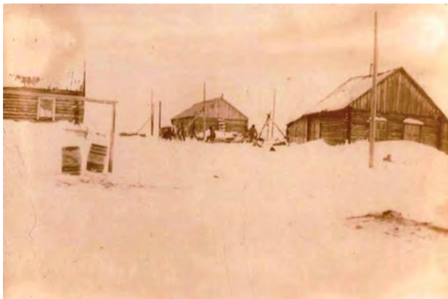
Домики 70-х годов