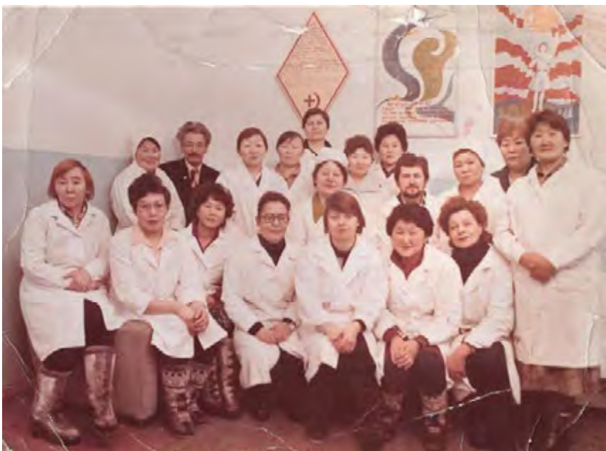
Коллектив Больницы конца 80-х г.