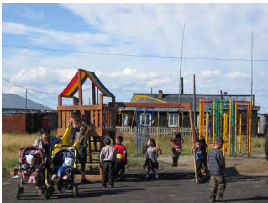
Детская игровая площадка