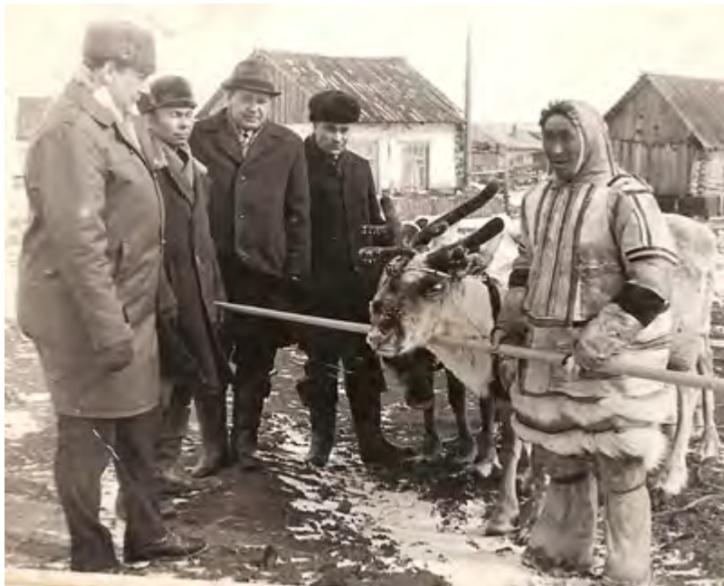
Приезд тундровиков в посёлок