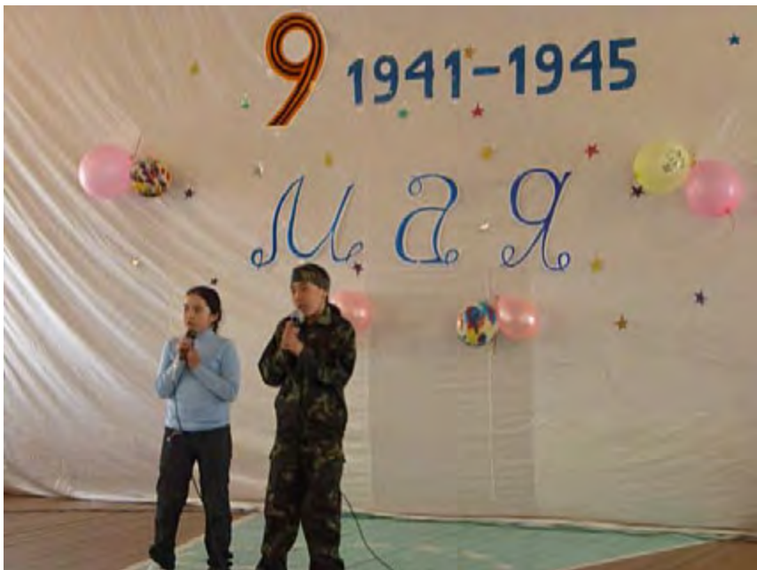
Мероприятия, посвященные Дню Победы