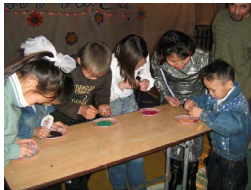
Конкурс в День семьи