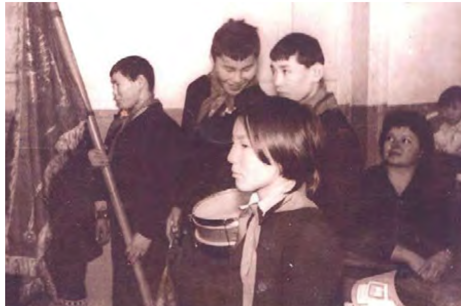
Пионеры школы начала 70-х г.