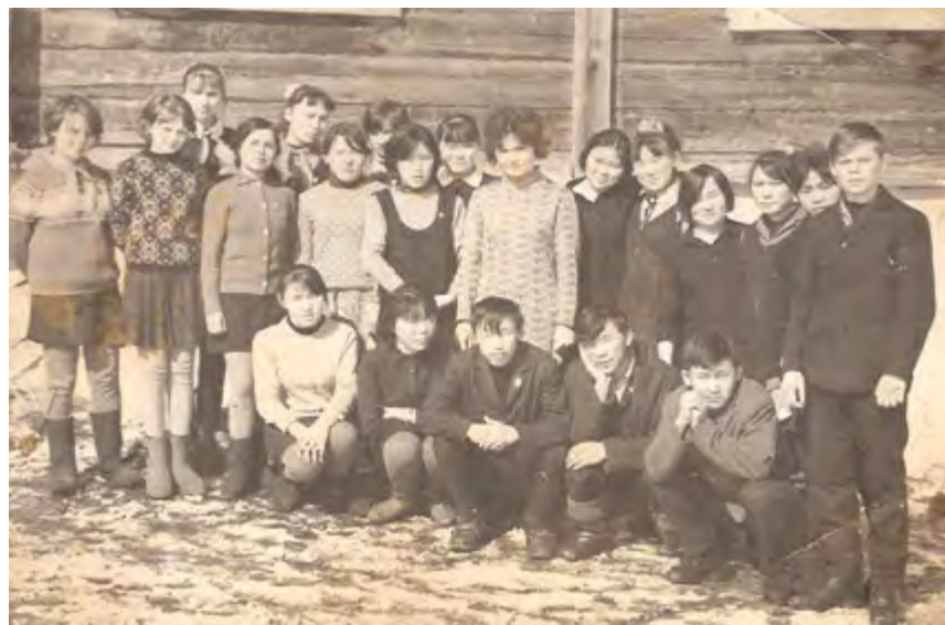
Учащиеся волочанской школы. 1970 год