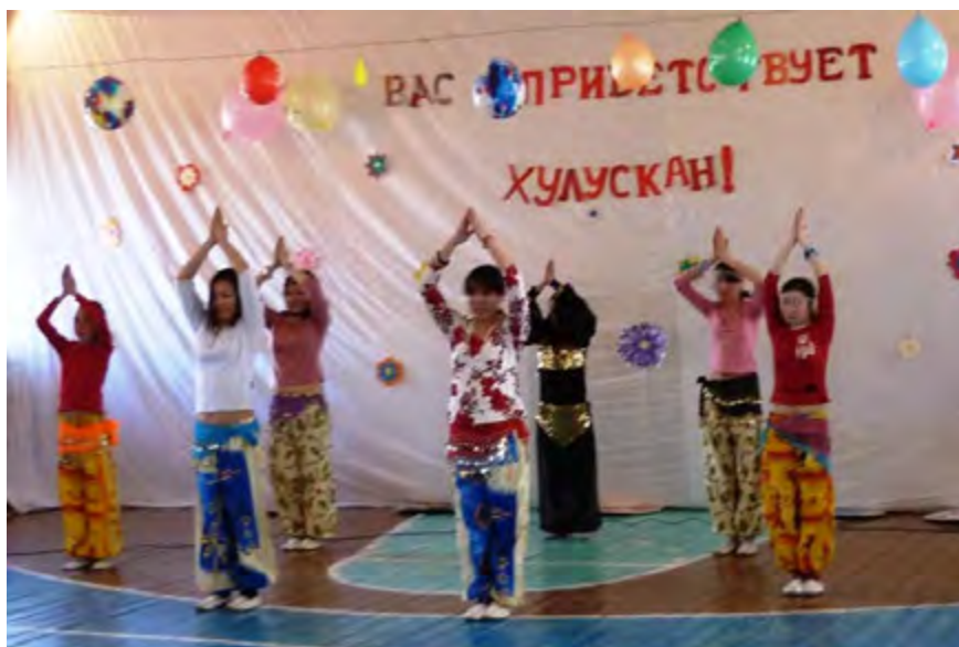
Выступает ансамбль «Хулускан»