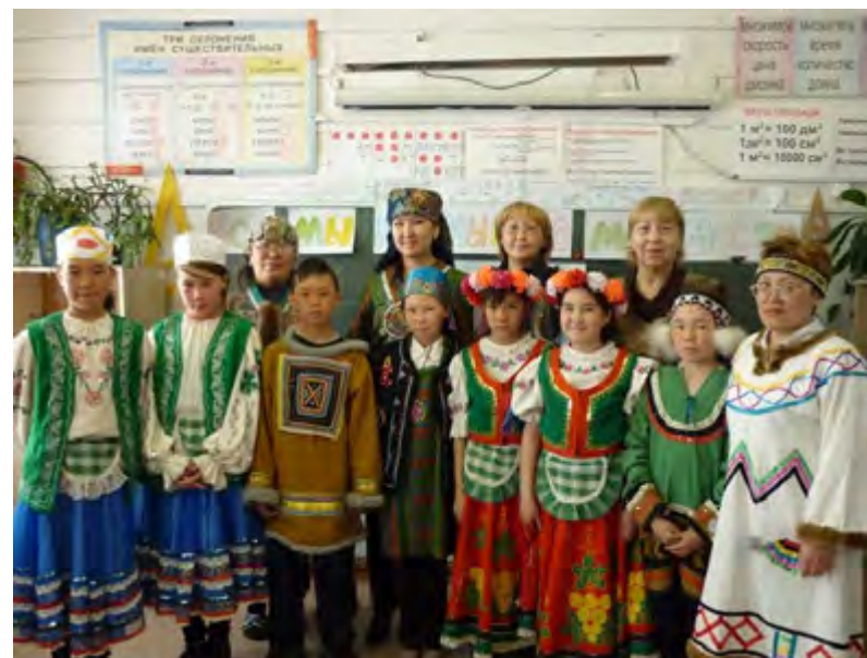
Мероприятие «Все мы разные, но мы вместе»