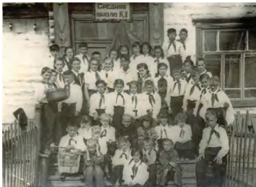
Пионерский сбор 50-е годы