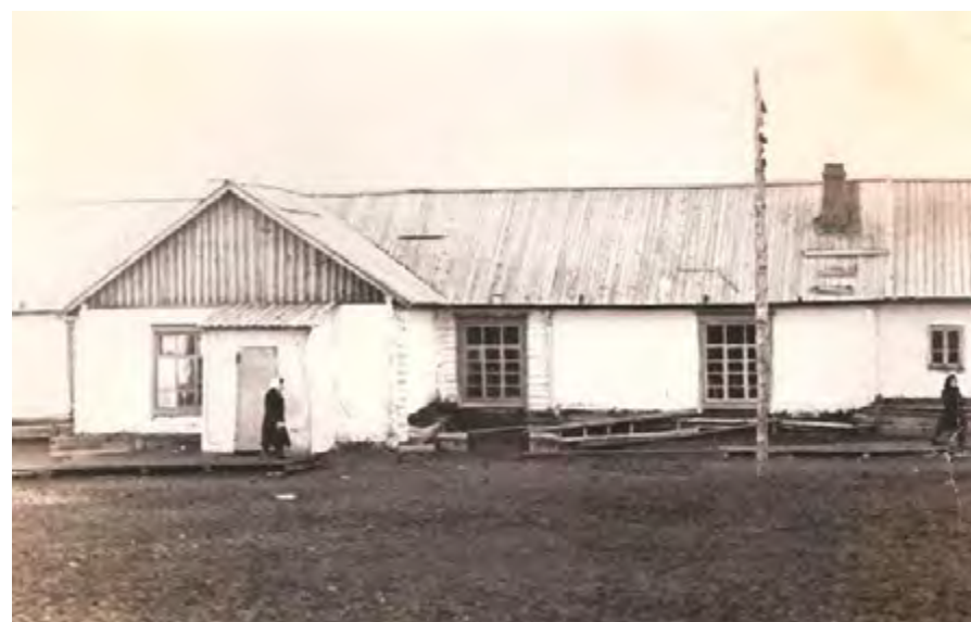
Здание сельского клуба