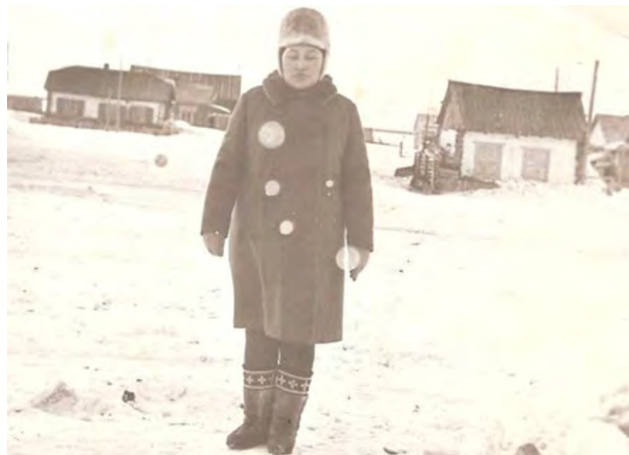
Улица Набережная, 70-е годы