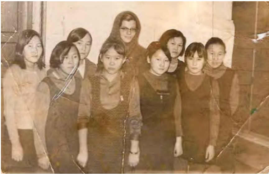
Ученики школы начала 70-х г.