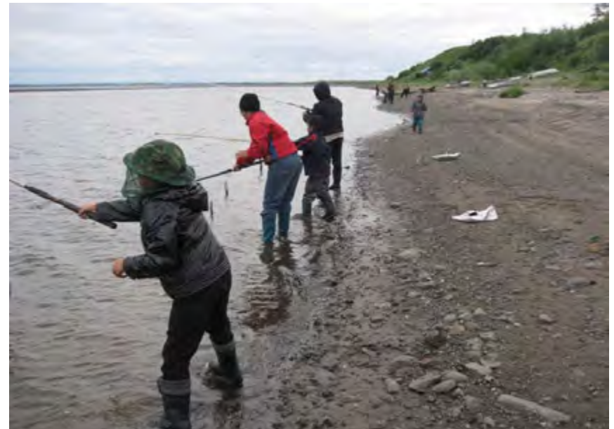
Конкурс рыбаков «Ловись рыбка большая и маленькая»