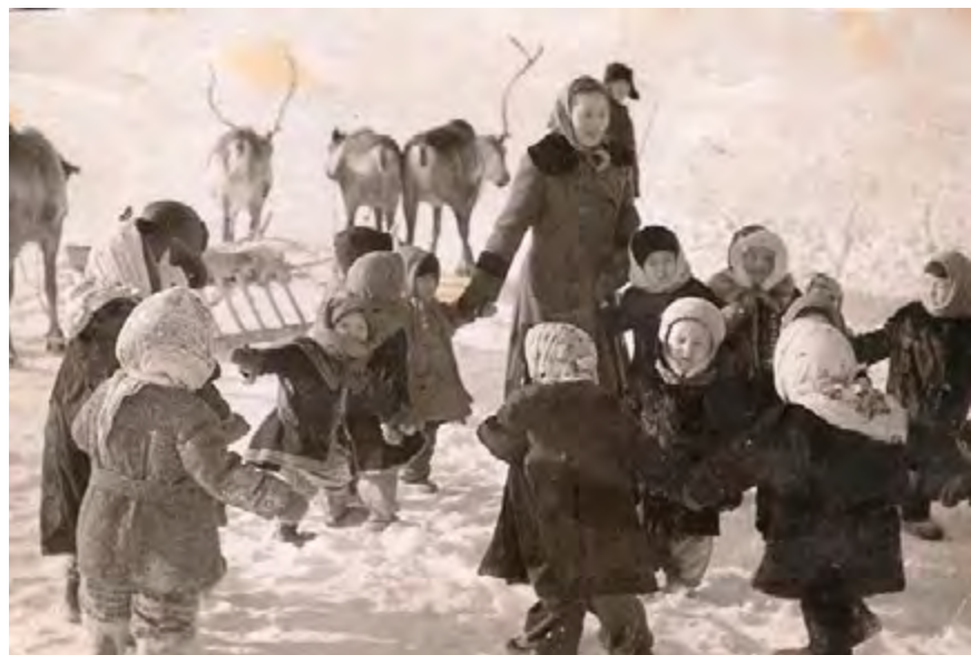
Детсад колхоза имени Сталина. 1959 год