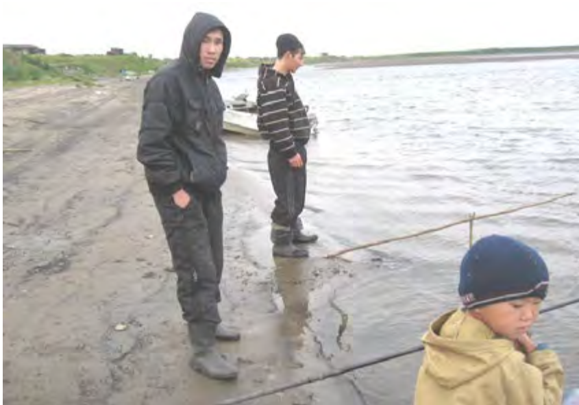
Конкурс рыболовов «Ловись рыбка большая и маленькая»