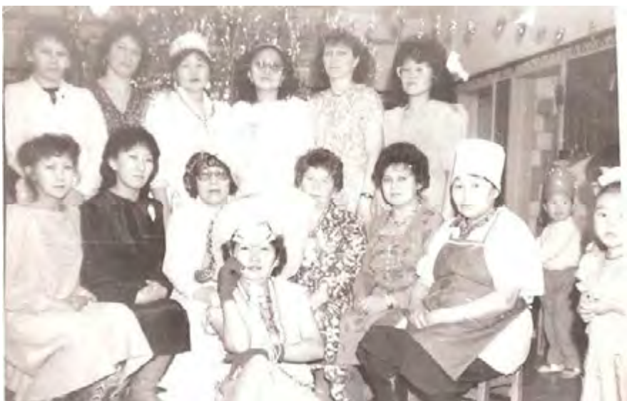
Коллектив детсада Снежинка