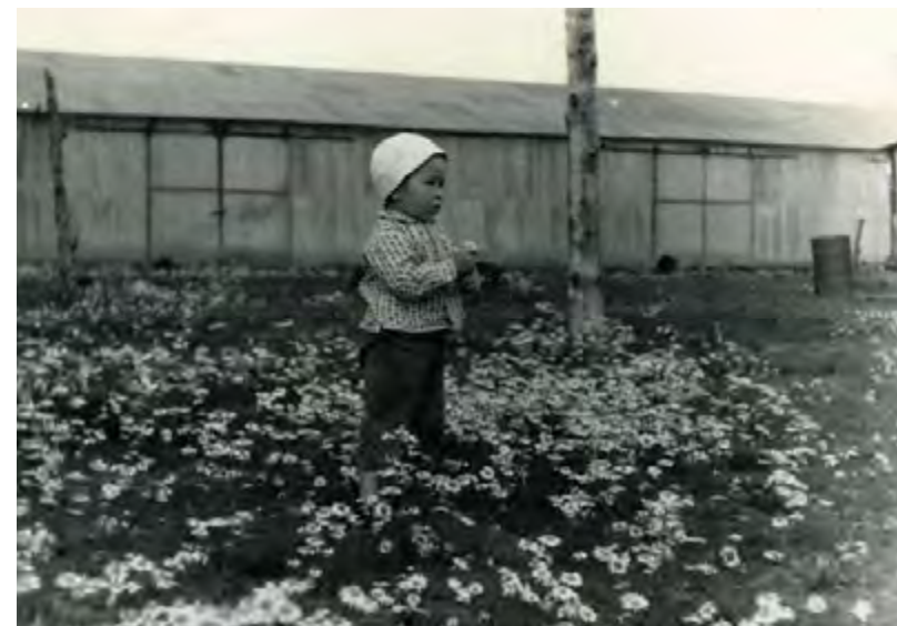
Склады пос. Волочанки. А.Н. Налтанова 1964 год