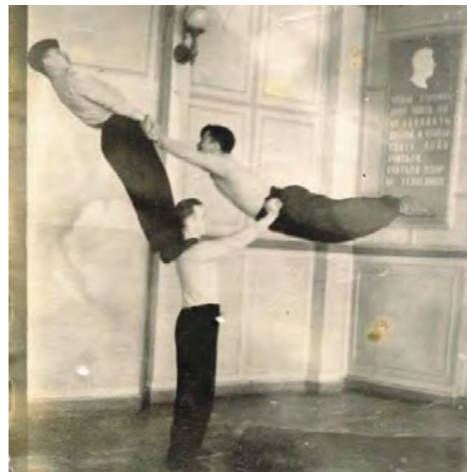
Спортивные номера, школьники 1953 год