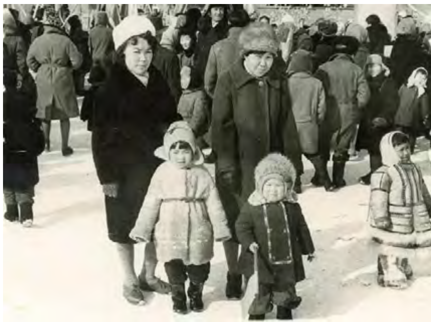
Демонстрация. 1964 год