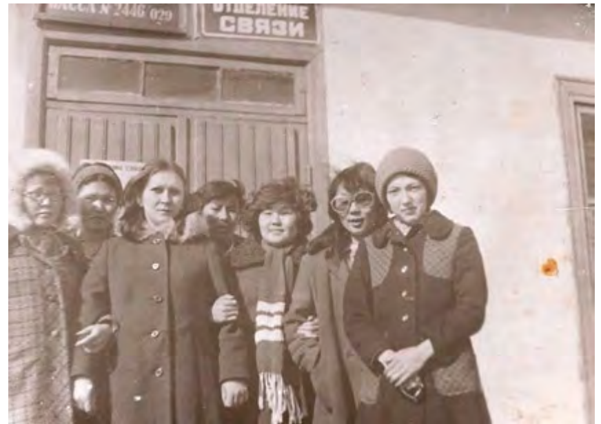
Ученики школы середины 70-х г.