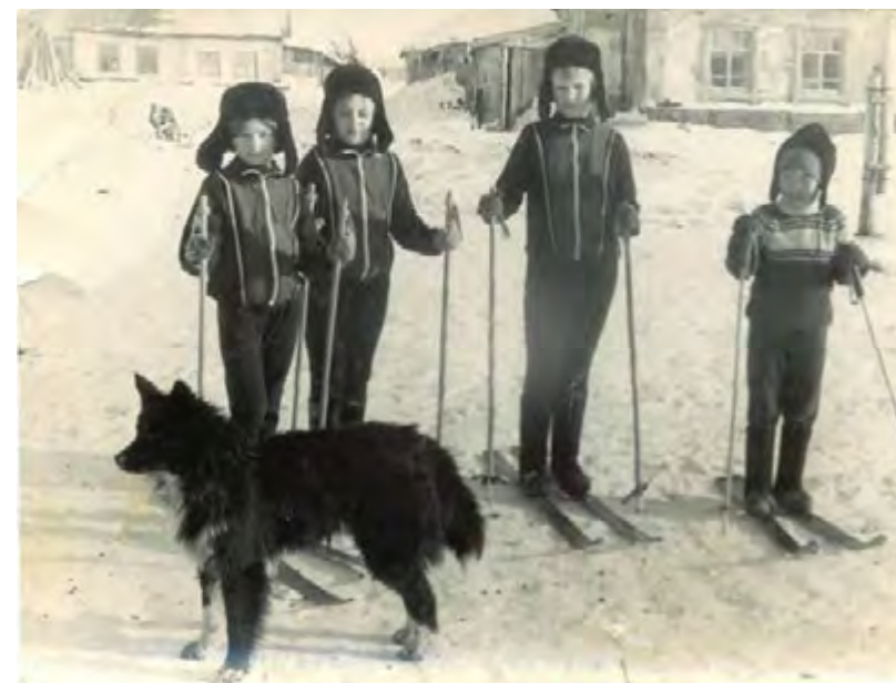
Отдых школьников. 1964 год