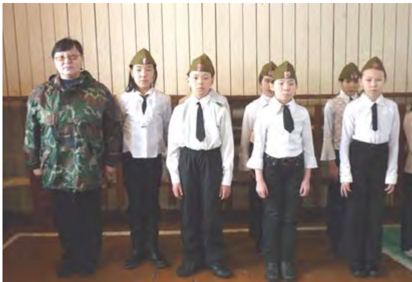
Праздник песни и строя