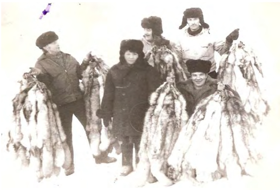
Продукция зверофермы совхоза