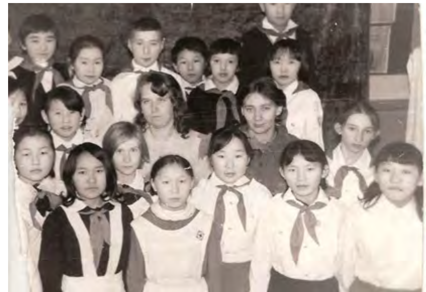
Ученики школы середины 70-х г.