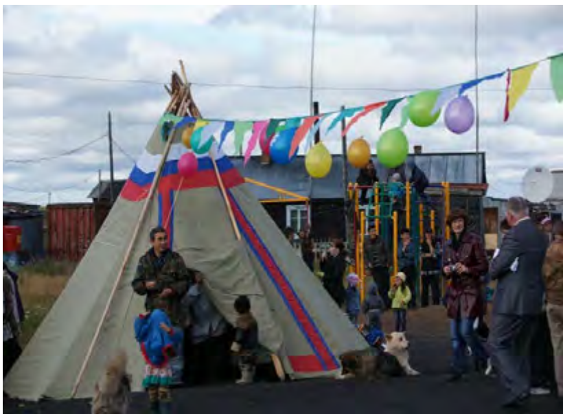
День поселка. 2011 год