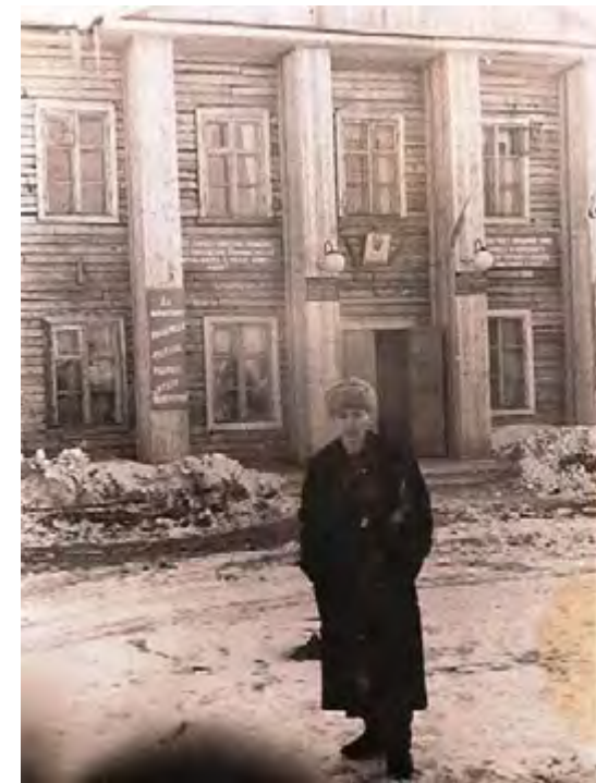
Райисполком, райком комсомола