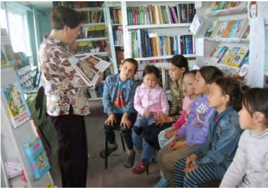
Мероприятия в библиотеке