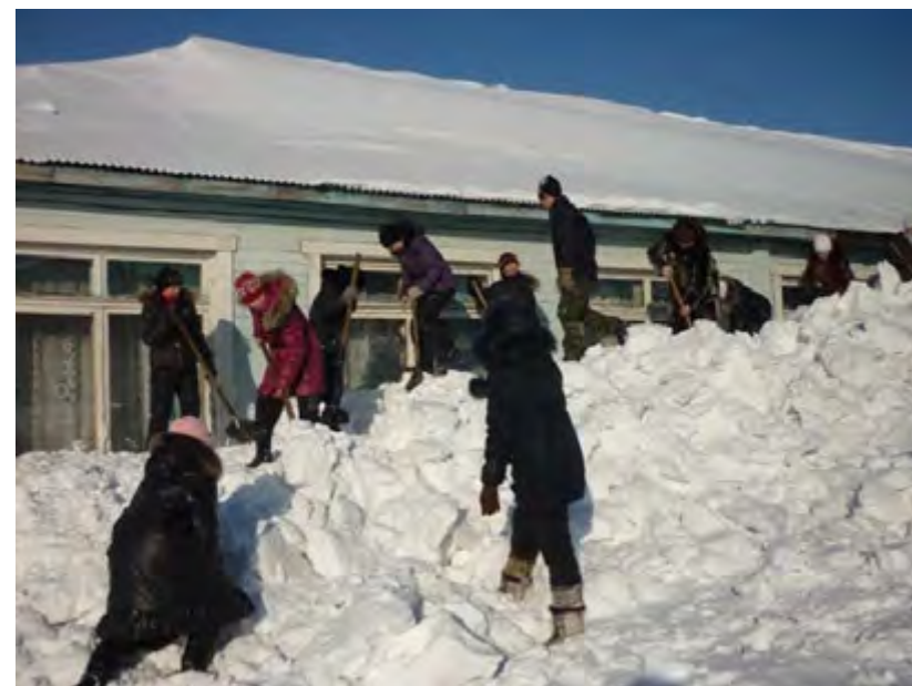
Трудовой десант, весна. 2011 год