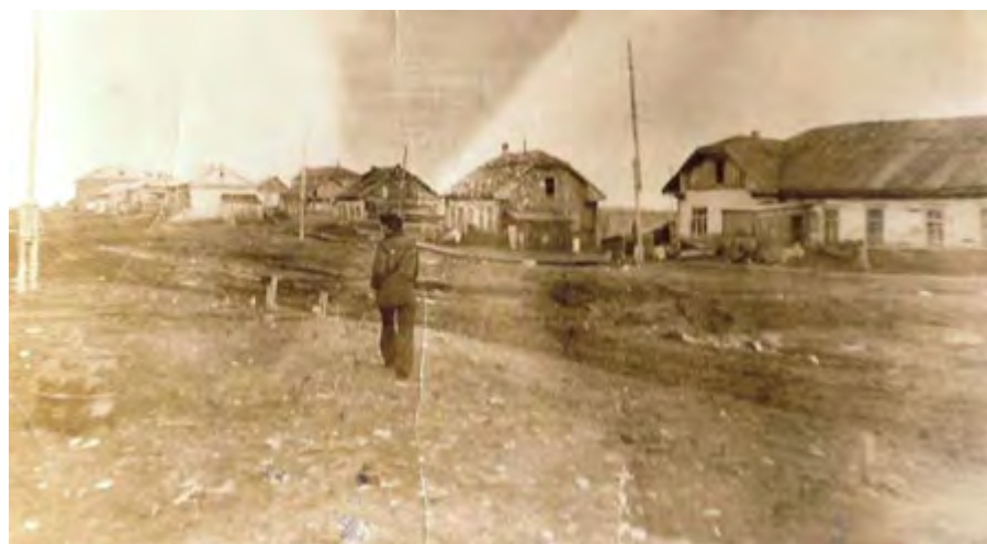
Улица Набережная, 70-е годы