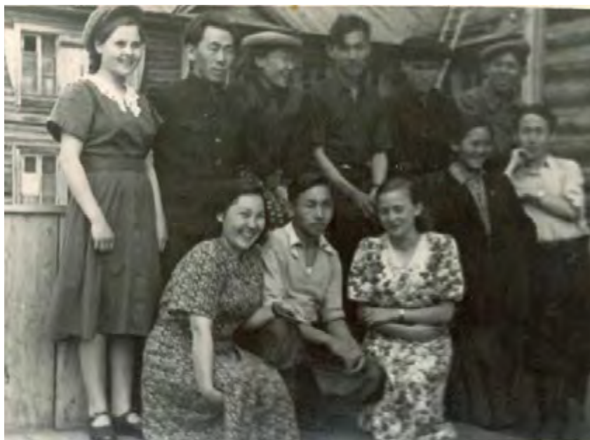
Молодежь Волочанки 50-е годы