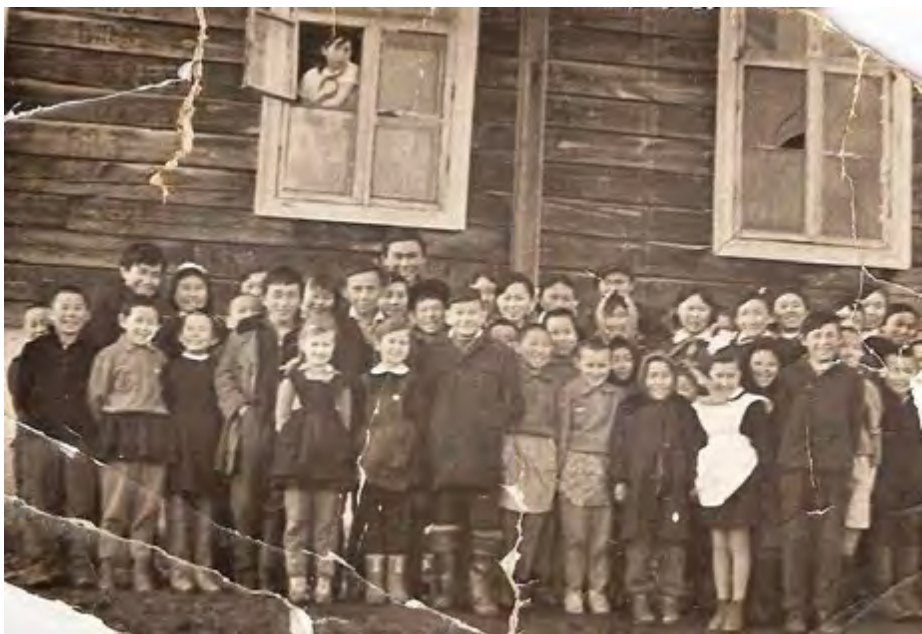
Воспитанники интерната. 1966 год