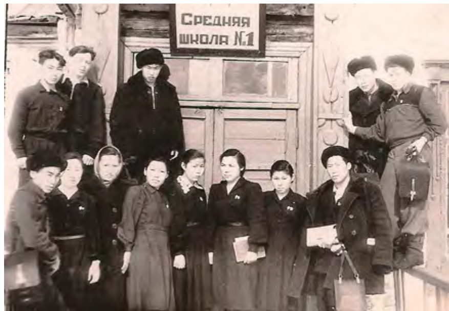
Выпускники Волочанской школы. 1956 год