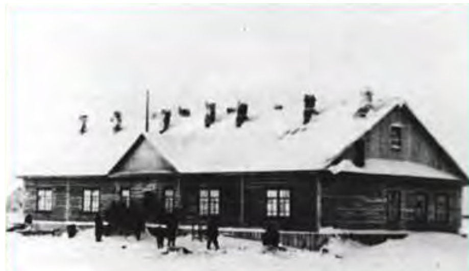
Интернат 70-е годы