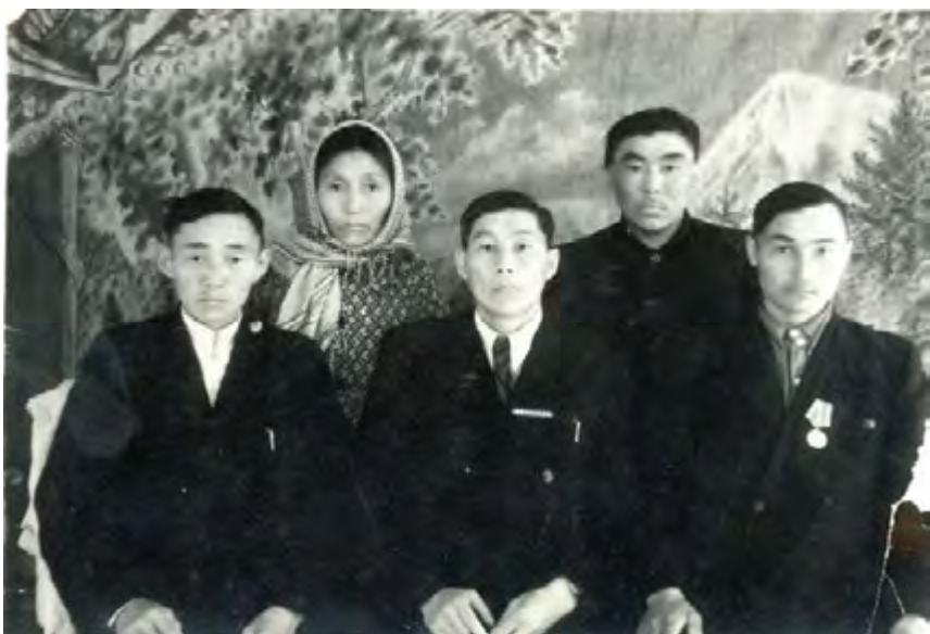
Группа делегатов перед отъездом на Всесоюзную сельскохозяйственную выставку. 1954 год