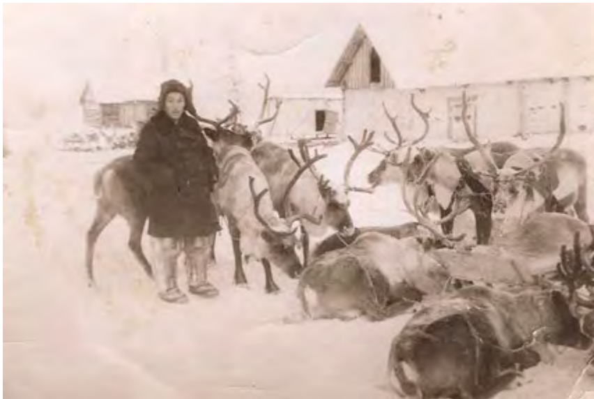
Приезд тундровиков в посёлок