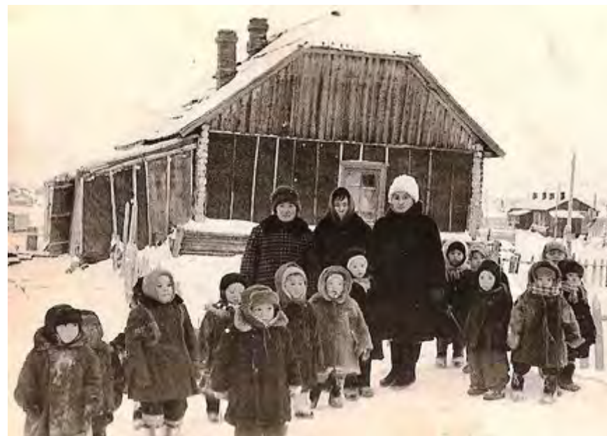
Детсад совхоза Волочанский. 1966 год