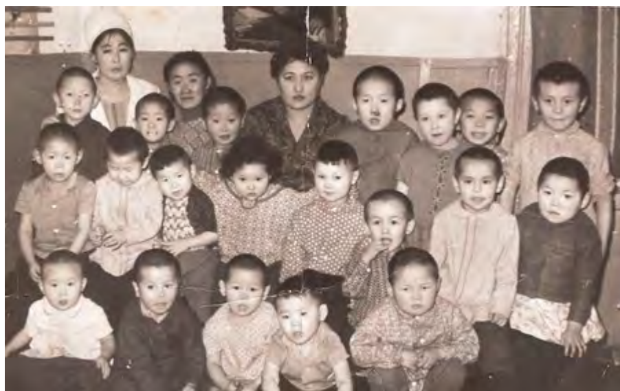
Детсад совхоза Волочанский. 1969 год