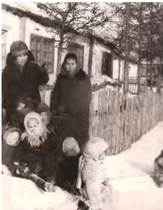
Воспитанники детского сада