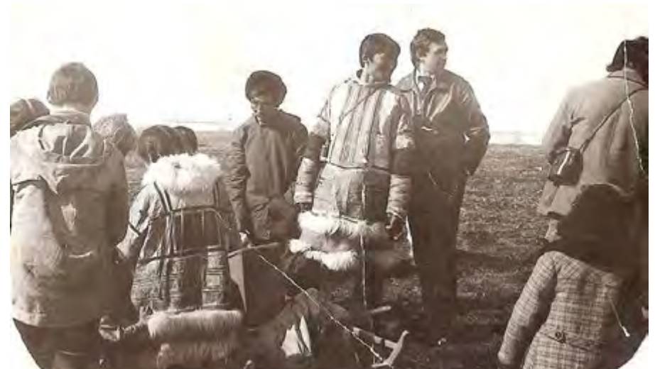
Прилёт вертолётa в оленеводческую бригаду