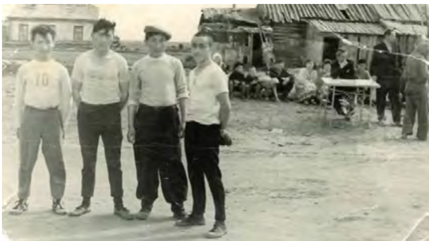
Спортивные соревнования 50-е годы