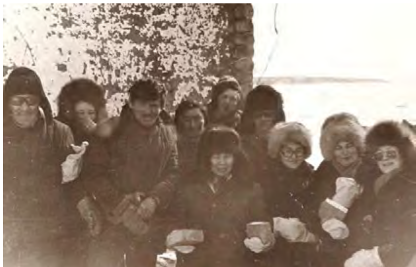
Работники совхоза на субботнике